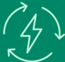
Kokgryta (200 liter)